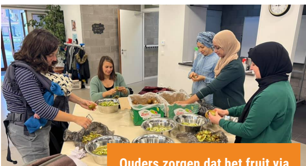
Ouders zorgen dat het fruit via Oog voor Lekkers verdeeld wordt over de kinderen.

Dan kan u een gift storten op volgend rek-nr: BE10 0000 0000 0404 van de KBS Met verplichte gestructureerde vermelding: 623/3652/30068