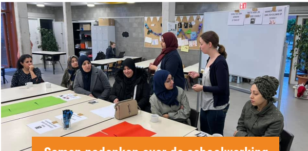
Samen nadenken over de schoolwerking van onze kleuterschool.

En ook op donderdag 11/11/2021 is de school gesloten, want het is Wapenstilstand en Sinte-Mette (of Sint-Maarten).