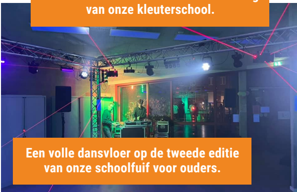
Een volle dansvloer op de tweede editie van onze schoolfuij voor ouders.